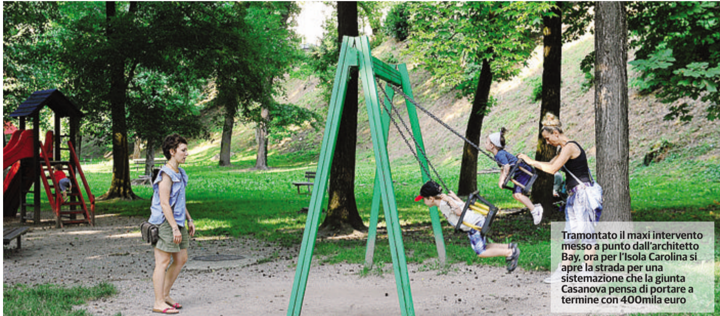
Tramontato il maxi intervento messo a punto dall'architetto Bay, ora per l'Isola Carolina si apre la strada per una sistemazione che la giunta Casanova pensa di portare a termine con 400mila euro

BROLETTO - 1 Arriva in consiglio il piano della giunta: 400mila euro per il parco dopo il flop del progetto Bay