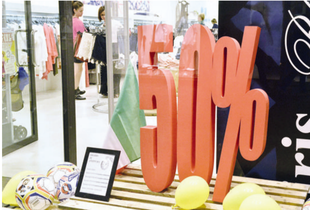
Una pubblicità dei saldi in un negozio lodigiano, sabato prende il via con una festa la "sessione estiva" degli sconti